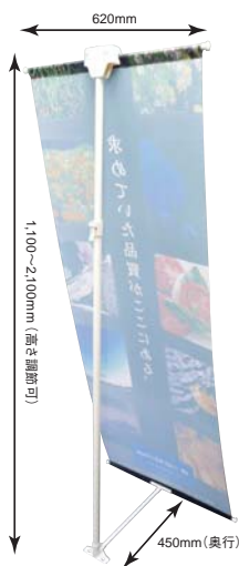
MX-2 背面 (数値はスタンド設置時のサイズ)